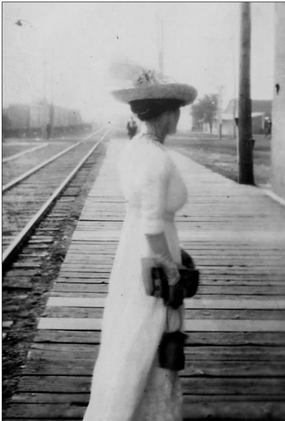
1 Rose à la gare

Elle gagne bien sa vie; très élégante, elle est toujours bien vêtue et arbore des chapeaux très recherchés.